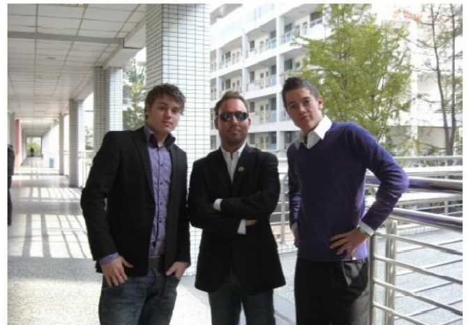
Höchste Konzentration kurz vor dem Besuch des Ministerpräsidenten.