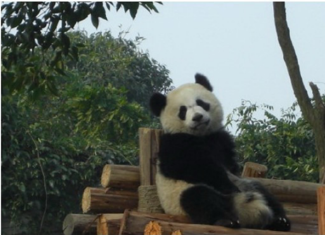
Die wohl beliebtesten Tiere der Welt, die drolligen Pandas aus Sichuan.