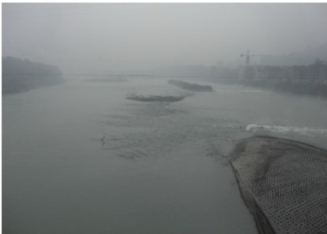
Besuch eines weiteren UN-Weltkulturerbes, des Dujiangyan-Bewässerungssystems.