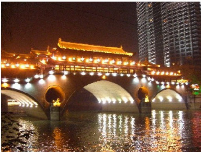
Chengdu by night.