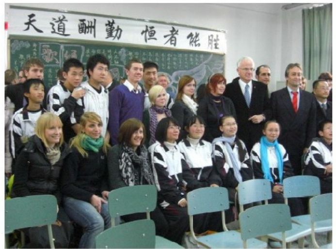
Dr. Jürgen Rüttgers und Schülerinnen und Schüler des LfG und der CDEFLS.