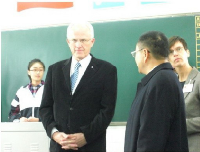
Ministerpräsident Dr. Jürgen Rüttgers besucht unsere Partnerschule.