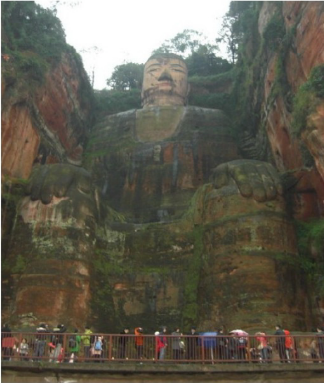
Besuch des Großen Buddha von Leshan, dieser Buddha ist der größte der Welt.